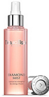
DIAMOND MIST Esencia bio-energética