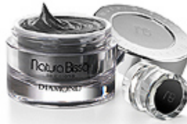
DIAMOND MAGNETIC Magnoterapia mineral